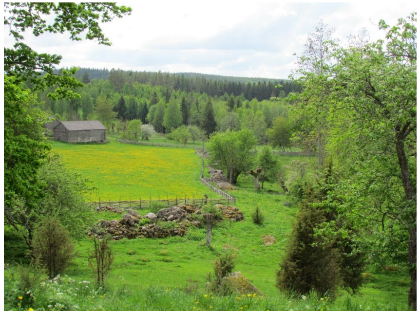
kulturresevatet Smedstorps dubbelgård

Södra Östergötland är en småbruten och ganska kuperad skogs- och mellanbygd med många små välskötta gårdar, tillsammans med en del gods och säterier. Historiskt är det här en blandning av ensädes- och tresädestrakter, till skillnad från slättbygdernas tvåsädesbruk. Här finns flera mycket fina områden där många av de här kvaliteterna fortfarande hålls levande.