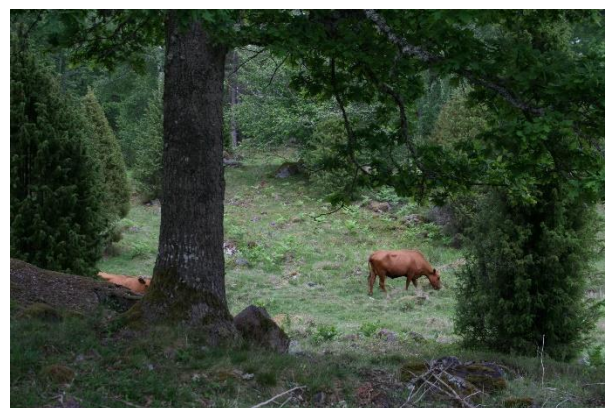
En markanvändning som nu åter kommer i gång i utmarkerna