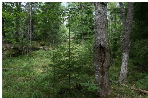
Biologiskt kulturarv: spår av markanvändning i Stensjö by

Läs mer om utmarksbruk och skog på Hantverkslaboratoriets webbplats .