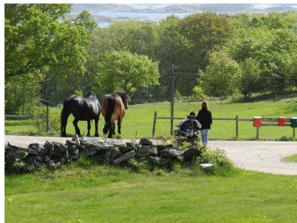
delaktighet för alla