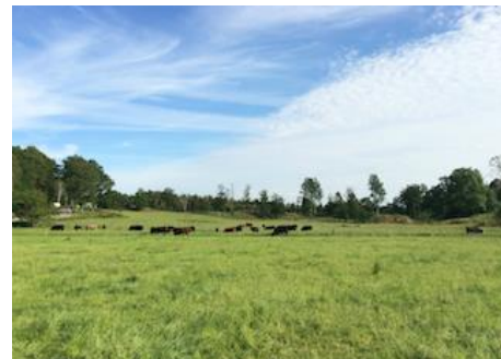
betesmarker vid Bjällansås

Vi använder oss därför av verktyget holistic management i planeringen av vårt bete. Vårt mål är att senast 2022 ha minskat vår stallperiod från nuvarande ca 190 dagar till 60 dagar i snitt. Fördelarna är många. En kortare stallperiod innebär bland annat att vi drastiskt kommer minska vår användning av fossila bränslen, då de i stor utsträckning används till stallperioden. Vi tror också att vi kommer kunna öka kolinlagringen i marken och mångfalden av gräs och örter ovan jord.