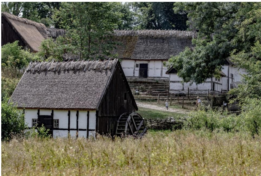
Gamlegård vid Kulturens Östarp.

Är ett friluftsmuseum som visar bondgården i sitt rätta sammanhang. Sedan starten 1924 har målet varit att tillsammans med ursprunglig bebyggelse visa de lantrasdjur, odling och landskap som varit förutsättningen för ett jordbruk och familjeliv. Kulturens Östarp består av två gårdar, en som visar tiden i början av 1800-talet och en som visar det tidiga 1900-talets lantbruk. I tillägg finns ett gästgiveri samt Møllegården, bostad åt museets djurhållare.