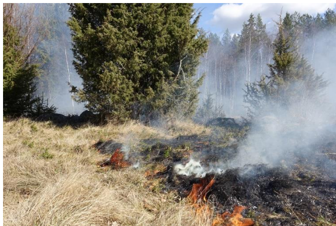
bränning i Motala äng i nordvästra Östergötland – april 2017