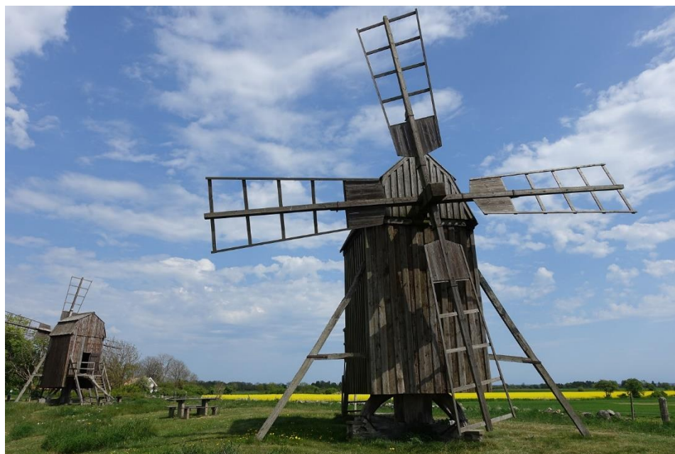
På Ölands östra sida kan det se ut så här

Ofta när man arbetar med kulturlandskapet och hur det kan skötas, så fokuserar man på ett enskilt skifte, det må vara en åker, en äng eller en betesmark. Eller så handlar det om stängsling, hamling eller liknande. Samtidigt är det helheten som avgör förutsättningarna för att lyckas. Hur kan man hitta balansen mellan markerna, djurbesättningarna, stall- och foderutrymmen, med mera? Hur kan man nå fram till god djurhälsa, god vitalitet i markerna och en god avkastning – samtidigt som man främjar och utvecklar natur- och kulturvärdena? Se mer om detta här .