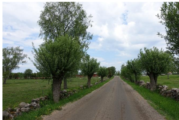
Infarten till Borgs by på mellersta Öland

Borgs by är en av Kungliga Vitterhetsakademins kulturfastigheter. Den stora borgen vittnar om att människor vistats på platsen sedan mycket lång tid. Själva byn är från 1800-talet. Sedan Vitterhetsakademien tog över ägandet i mitten av 1900-talet har markerna efter hand återfått sitt tidigare skick. Idag sköts området med en helhet av åkerbruk, ängshävd och djurhållning. Tack vare de goda förutsättningarna är det möjligt att bedriva ett brukande med stark inriktning på traditionell hävd och utveckling av natur- och kulturvärden. Resultatet? Det är en fröjd att besöka Borgs by!