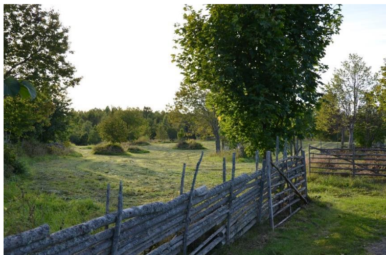
vid Tråthult i Bråbygden

Framåtsyftande ändamål som t.ex. biomassa-uttag.