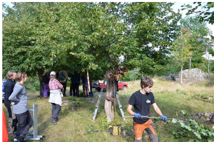
verkstad – i backen nedanför Träthult

Hantering av grenar, kvistar och löv. Direktutfodring till djur.